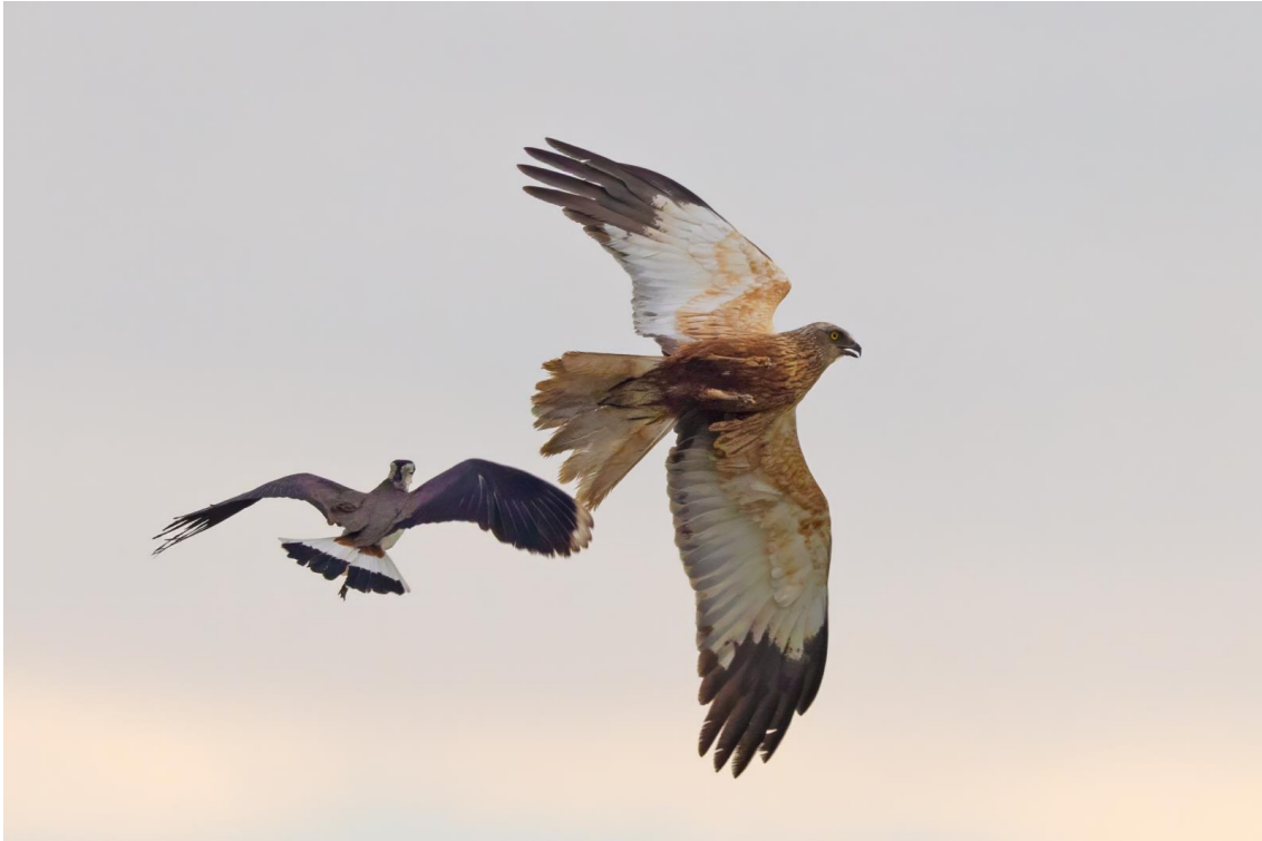
Pavoncella e falco di palude