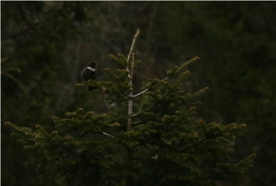
Merlo dal collare