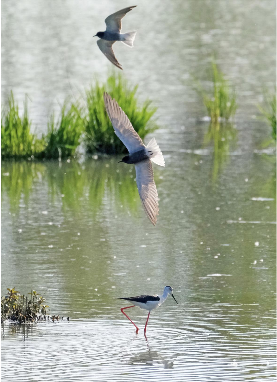
Mignattino comune e cavaliere d'Italia