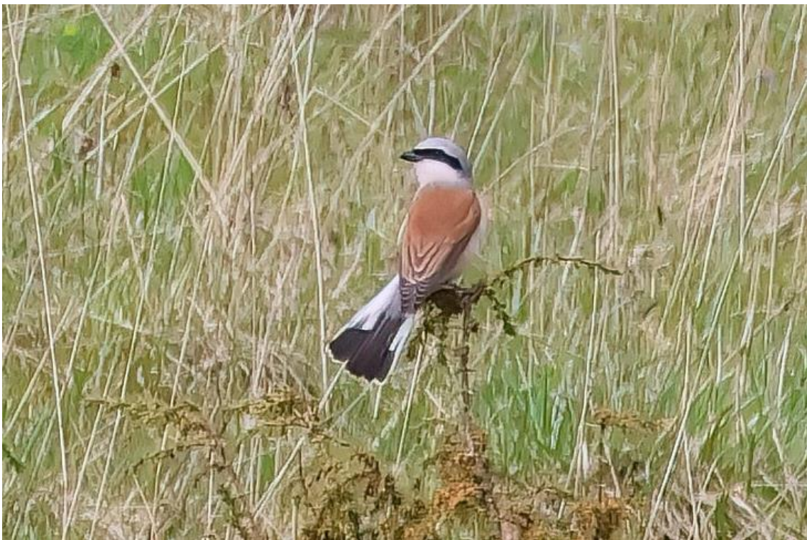
Averla piccola