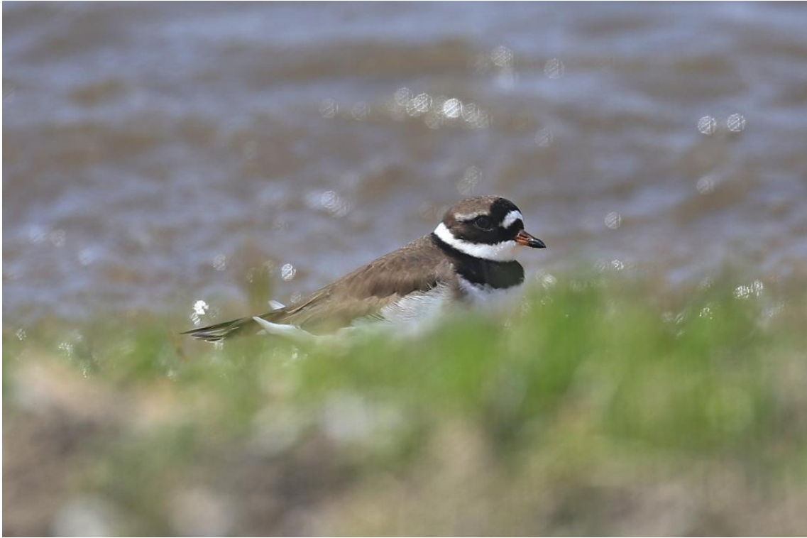
Corriere grosso