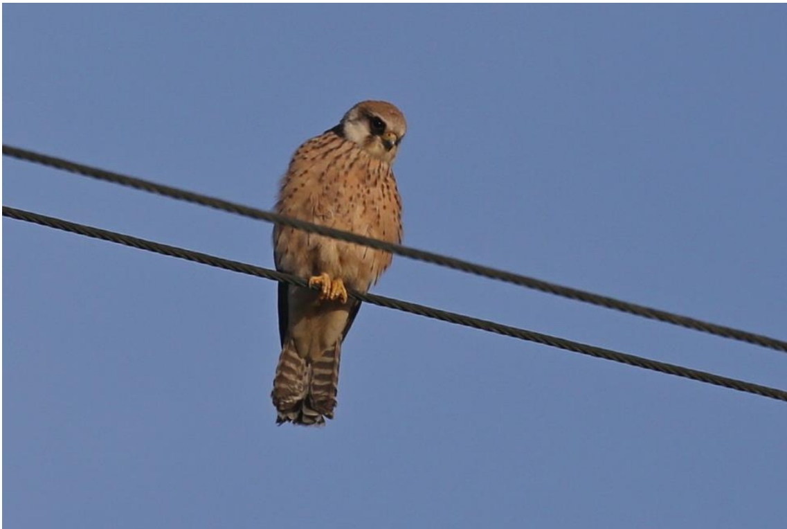
Falco cuculo