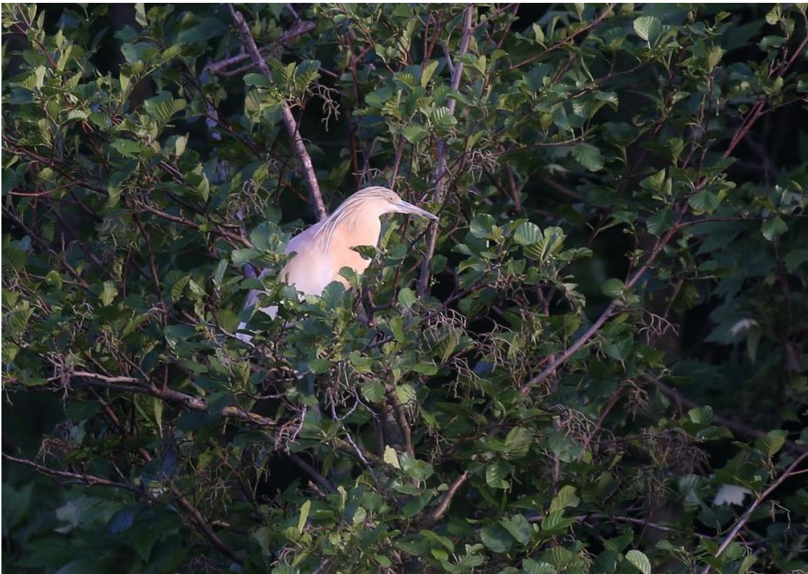
Sgarza ciuffetto