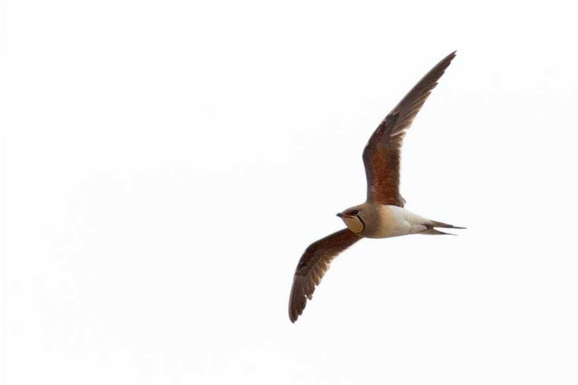
Pernice di mare