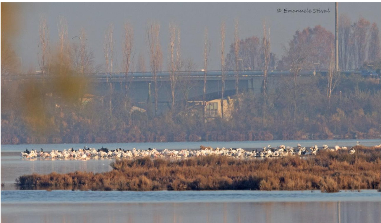
Raggruppamenti di fenicotteri in valle DragoJesolo