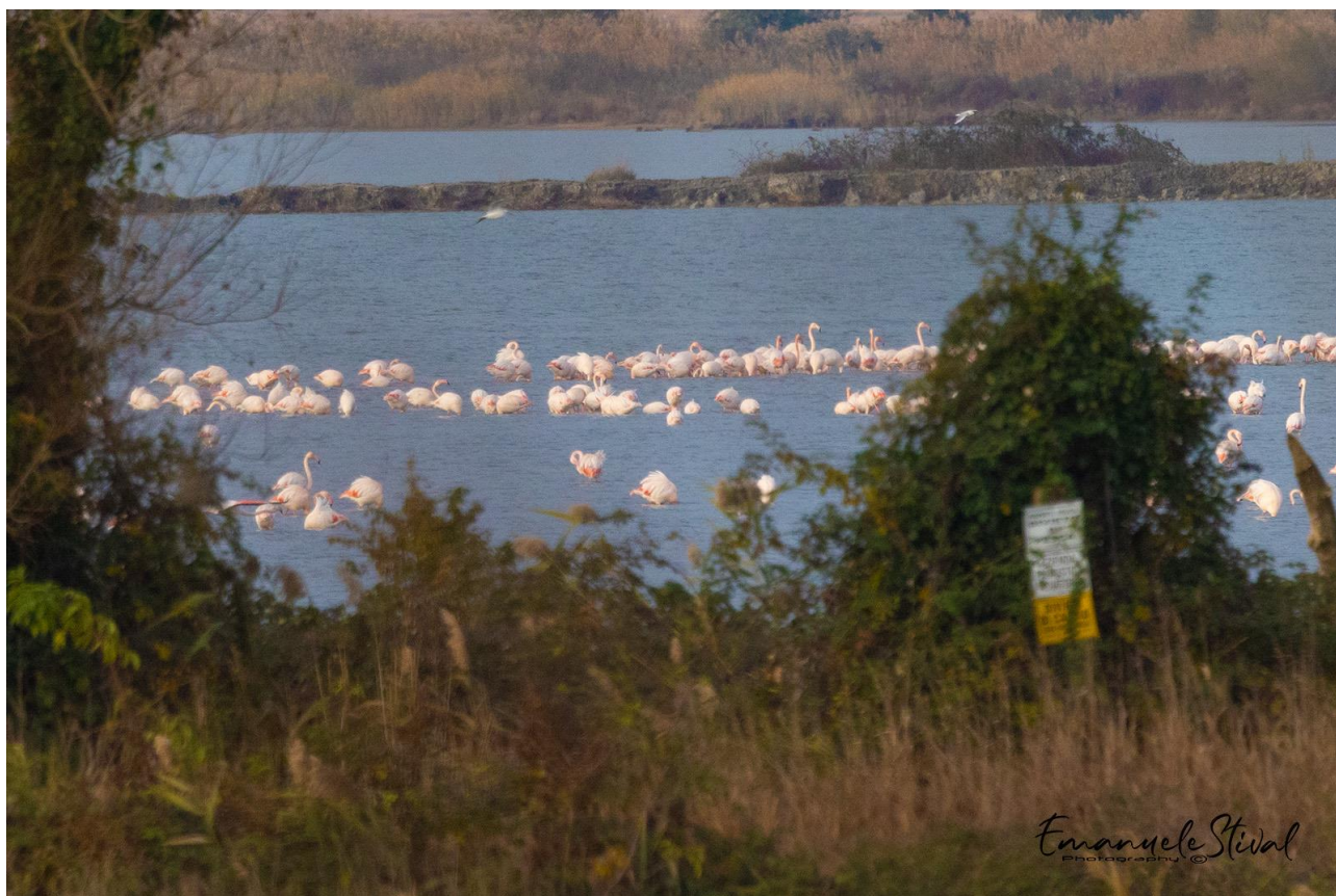
Raggruppamento di fenicotteri in valle Dogà

Il censimento ha potuto essere effettuato grazie alla collaborazione di EPS (Ente Produttori Selvaggina) e dei proprietari e gestori delle zone umide vallive visitate; desideriamo ringraziare tutti gli operatori di valle della laguna di Venezia e delle lagune di Caorle e Bibione e che ci hanno agevolato durante il monitoraggio.