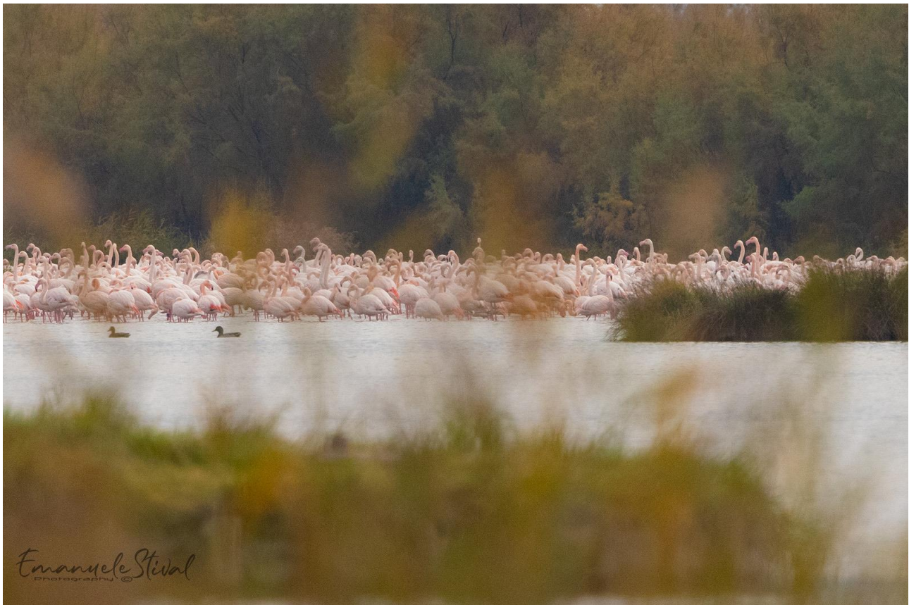
Raggruppamento di fenicotteri in valle Dogà